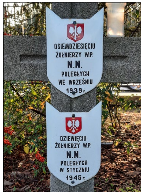
Wspólna mogiła żołnierzy obu armii

Takie niedoprecyzowanie nazwy ulicy uratowało ją zapewne przed dekomunizacją. Tylko