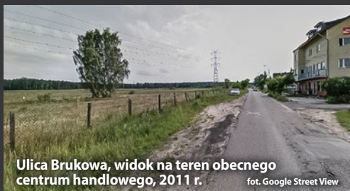
Ulica Brukowa, widok na teren obecnego centrum handlowego, 2011 r.

W pierwszym etapie, w listopadzie 2012 r., inwestycja przy placu do driftingu składała się z hipermarketu Auchan o powierzchni 12 tys. m 2 i przylegającej do niego galerii handlowo-usługowej o powierzchni 5 tys. m 2 , a kilka miesięcy później, w maju 2013 r., otwarto drugą część galerii handlowej o pow. 10 tys. m 2 .