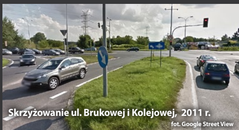
Skrzyżowanie ul. Brukowej i Kolejowej, 2011 r.

Żeby amatorom kontrolowanych poślizgów ułatwić dojazd do miejsca pokazów ich samochodowych umiejętności, powstał też wiadukt na skrzyżowaniu ulic Kolejowej i Brukowej oraz przedłużenie ul. Brukowej do ul. Treny (wcześniej do Trenów można było dojechać ul. Wiślaną lub ul. Partyzantów).