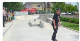
Skatepark przy ICDS