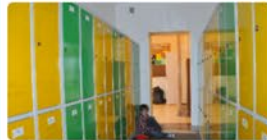
Remont Szkoły Podstawowej nr 1 w Łomiankach