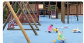
Place zabaw i siłownię plenerową