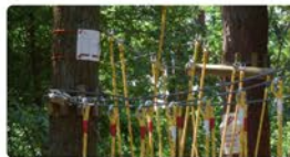
Park linowy w Dąbrowie