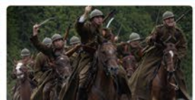
Koncerty, Potanicówki, Imprezy Rodzinne, Bitwa Pod Łomiankami