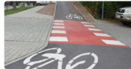
Budowa i remonty chodników i ścieżek rowerowych