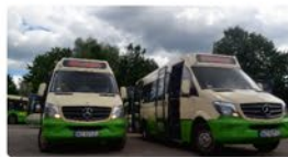
Rozwój taboru KMŁ miejskiej oraz darmowe linie lokalne