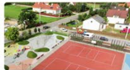
Boisko i plac zabaw w Kiełpinie