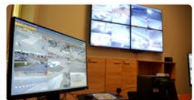
Centrum monitoringu miejskiego