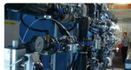
Stacja uzdatniania wody