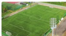
Pełnowymiarowe boisko przy ul. Wiślanej