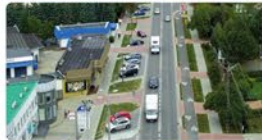
Budowa ponad 80 dróg