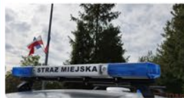
Patrole Straży Miejskiej