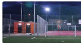
Boisko Orlik przy SP 1 w Łomiankach i przy ul. Wiślanej