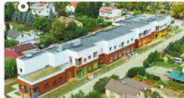
Budowa Przedszkola w Dziekanowie Leśnym