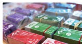
Wspólny bilet autobusowy z Warszawą