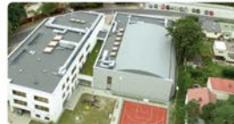
Budowa Szkoły Podstawowej nr 2 w Dąbrowie Leśnej