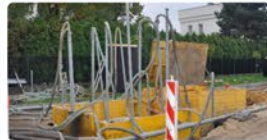
70 km sieci wodno-kanalizacyjnej