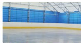
Kryte lodowisko przy ICDS