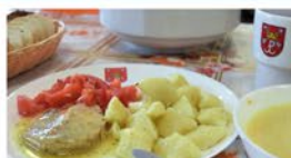
Obiady dla uczniów za 4 zł