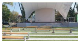
Budowa Sceny Plenerowej przy Domu Kultury