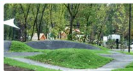
Park miejski przy ul. Fabrycznej