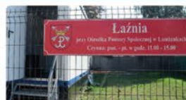
Łaźnia miejska przy OPS