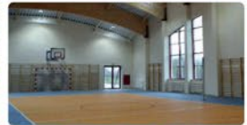
Rozbudowa Szkół Podstawowych w Dz. Leśnym i Dz. Polskim