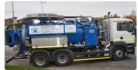
Efektywne zarządzanie spółkami oraz wielomilionowe dotacje